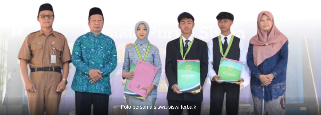
Foto bersama siswa-siswi terbaik

Harapan agar seluruh alumni angkatan ini mampu mengepakkan sayap setinggi mungkin. Semoga nilai-nilai karakter, kedisiplinan, serta kompetensi keahlian yang telah ditanamkan oleh almamater tidak hanya membawa mereka pada kesuksesan karier di dunia industri, tetapi juga menjadikan mereka generasi yang tangguh dan bermanfaat bagi masyarakat luas. Selamat melangkah, para wisudawan, dunia nyata telah menanti karya-karya terbaik kalian!