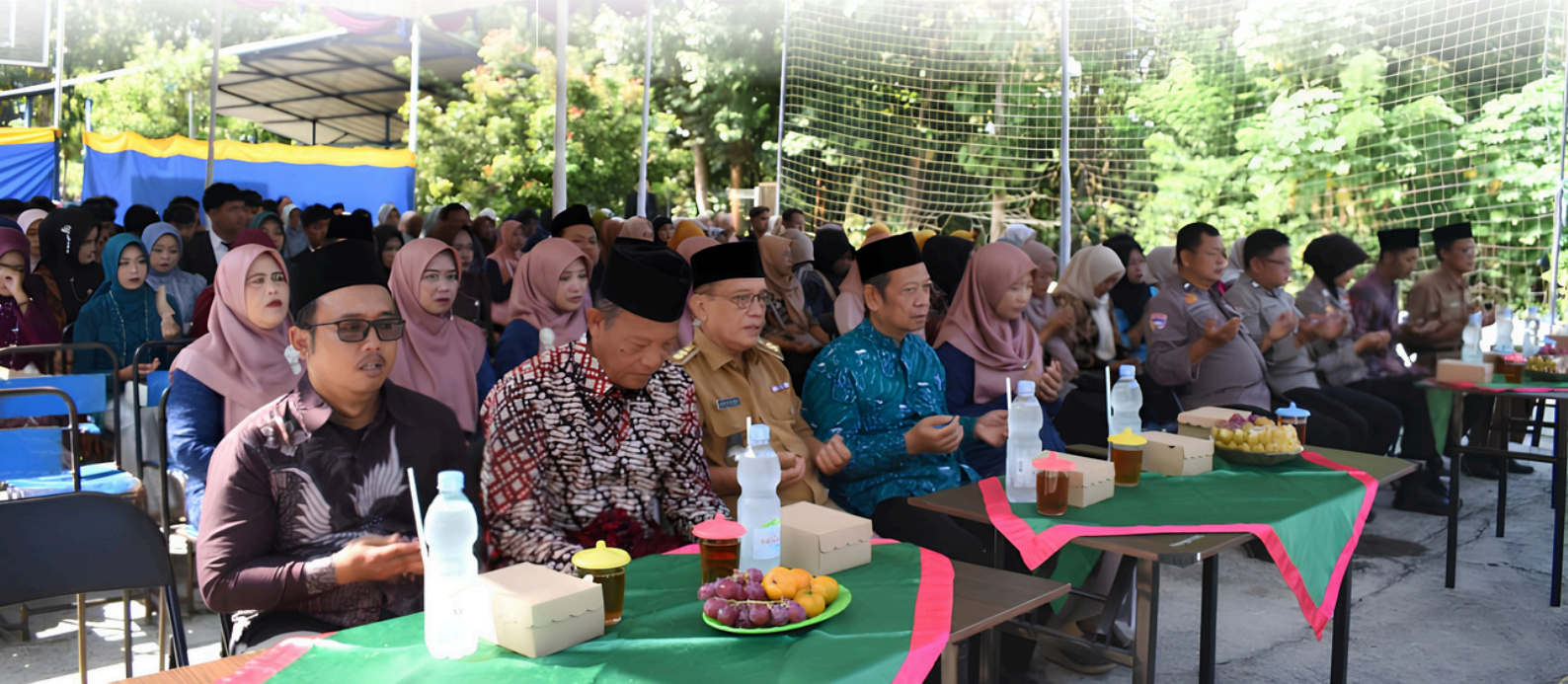
Suasana Pelepasan Siswa-Siswi Kelas 12 SMK Ma'arif Semanu