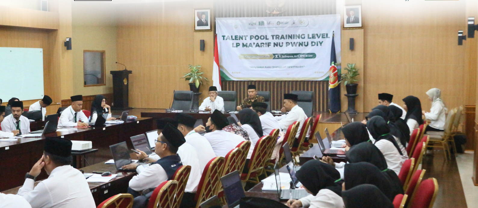
Hari Kelima Kegiatan Talent Pool Training Level I Angkatan 01 di Gedung DPD RI DIY