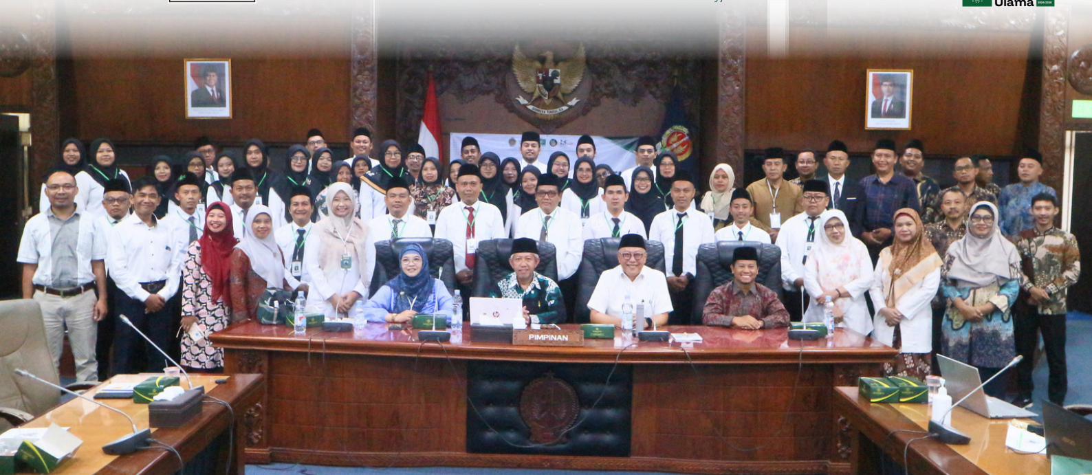
Foto bersama tamu undangan, pemateri, kepala sekolah, serta peserta TPT Level I angkatan 01 di Gedung DPRD DIY